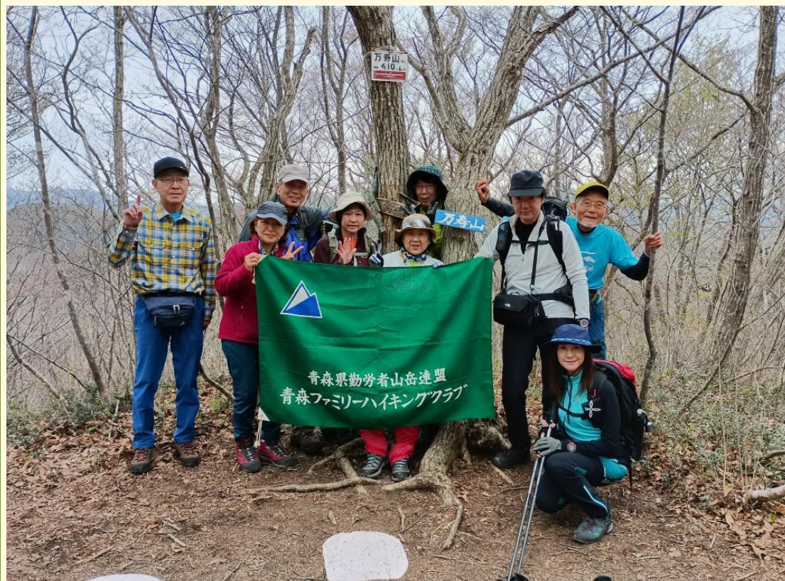
万寿山頂上にて