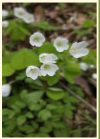
コミヤマカタバミ