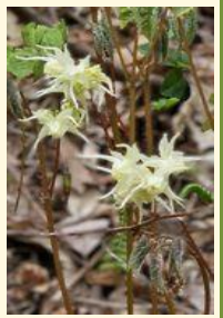
キバナイカリソウ