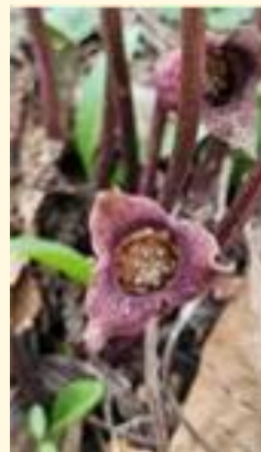
トウゴクサイシン