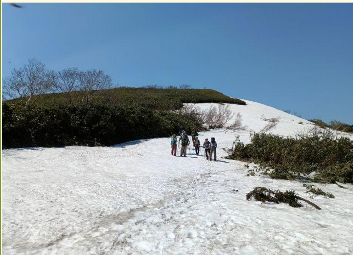
日差しは熱いが残雪が多い