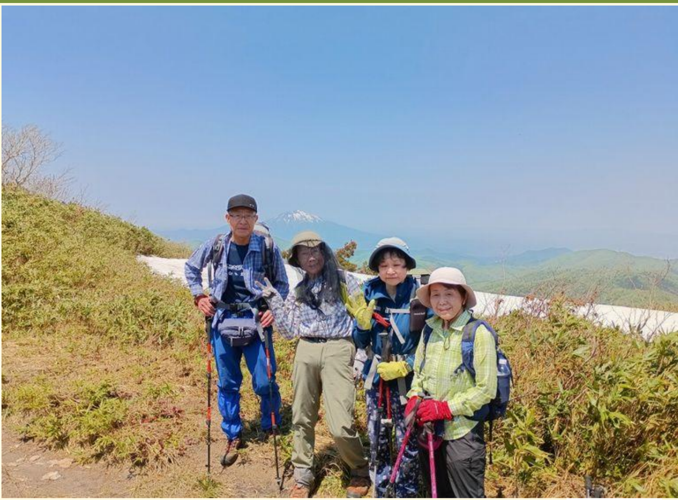
全く違う形の岩木山がかわいらしい