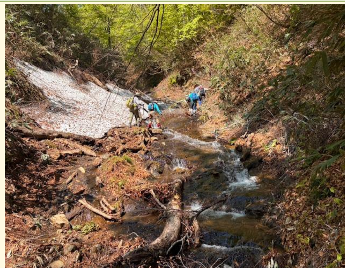
沢に落ちない様、細心の注意で沢登り