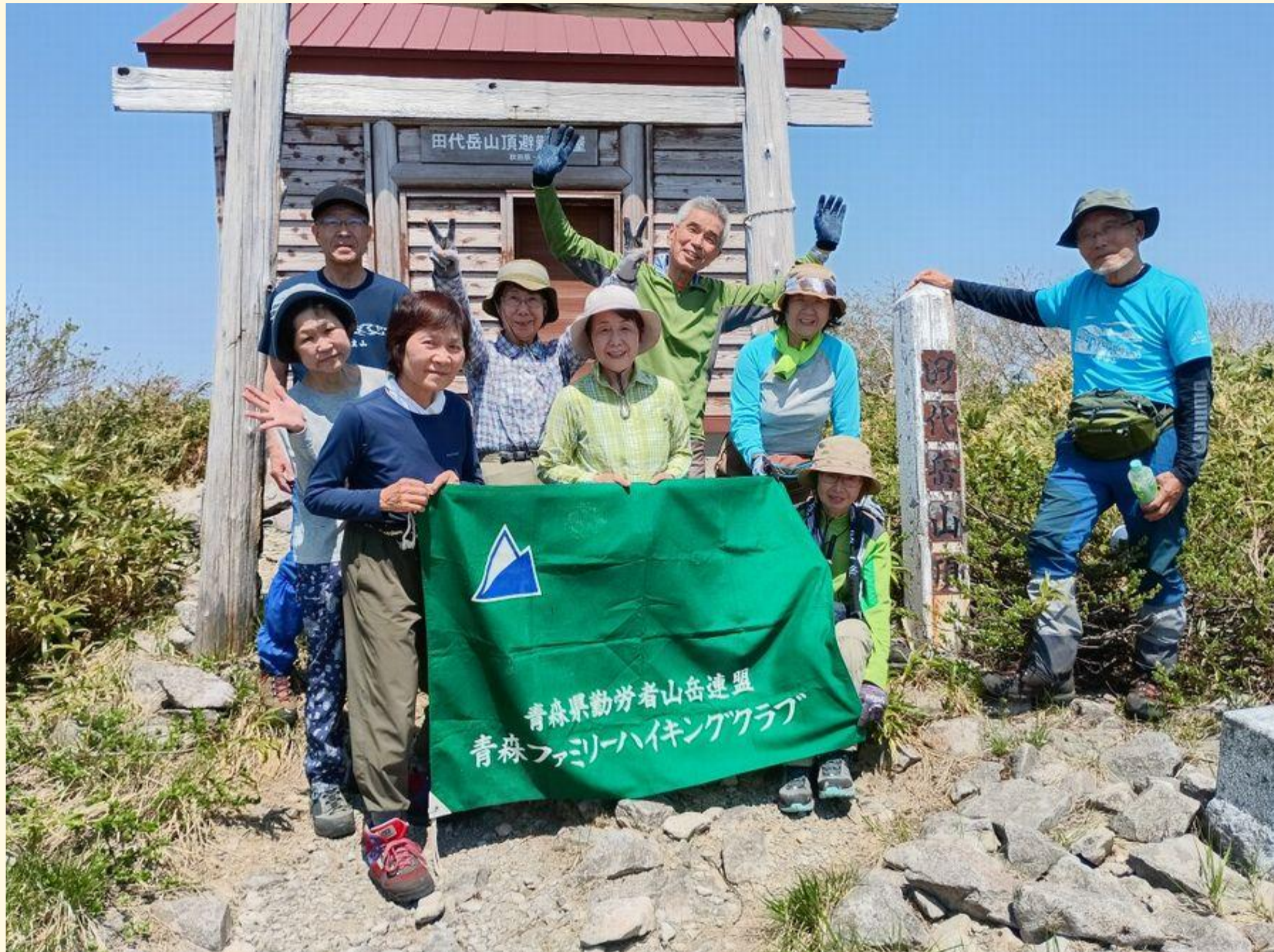
田代岳山頂避難小屋前で記念撮影