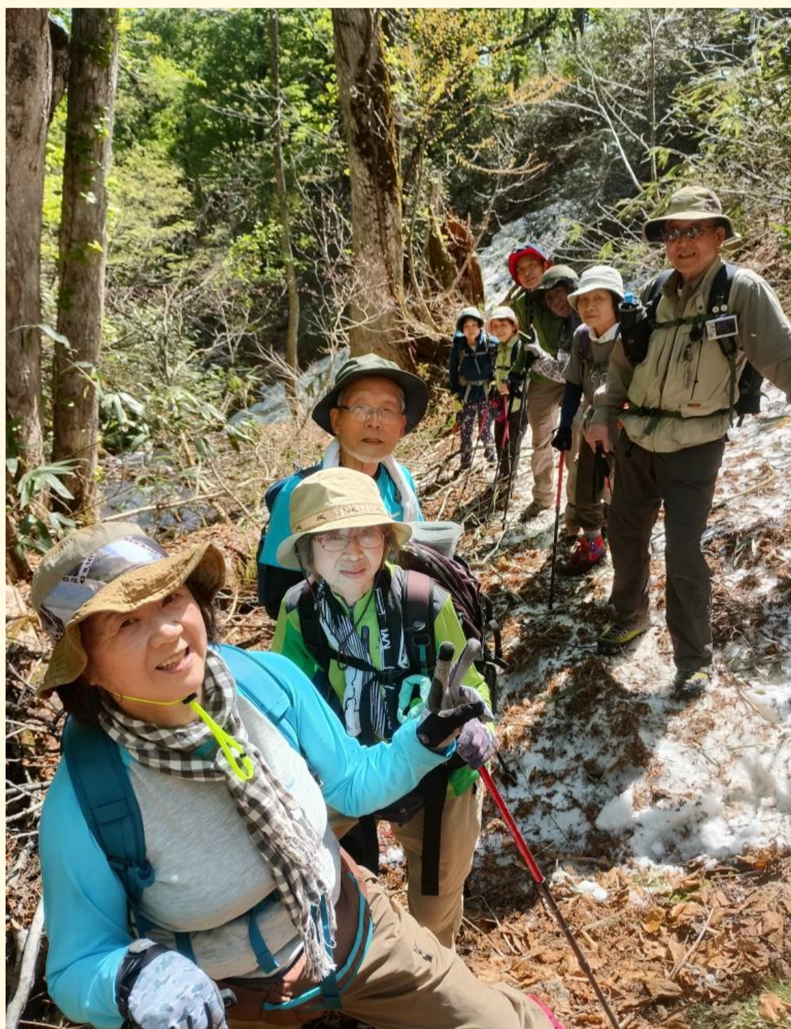
恒例の一行渋滞撮影