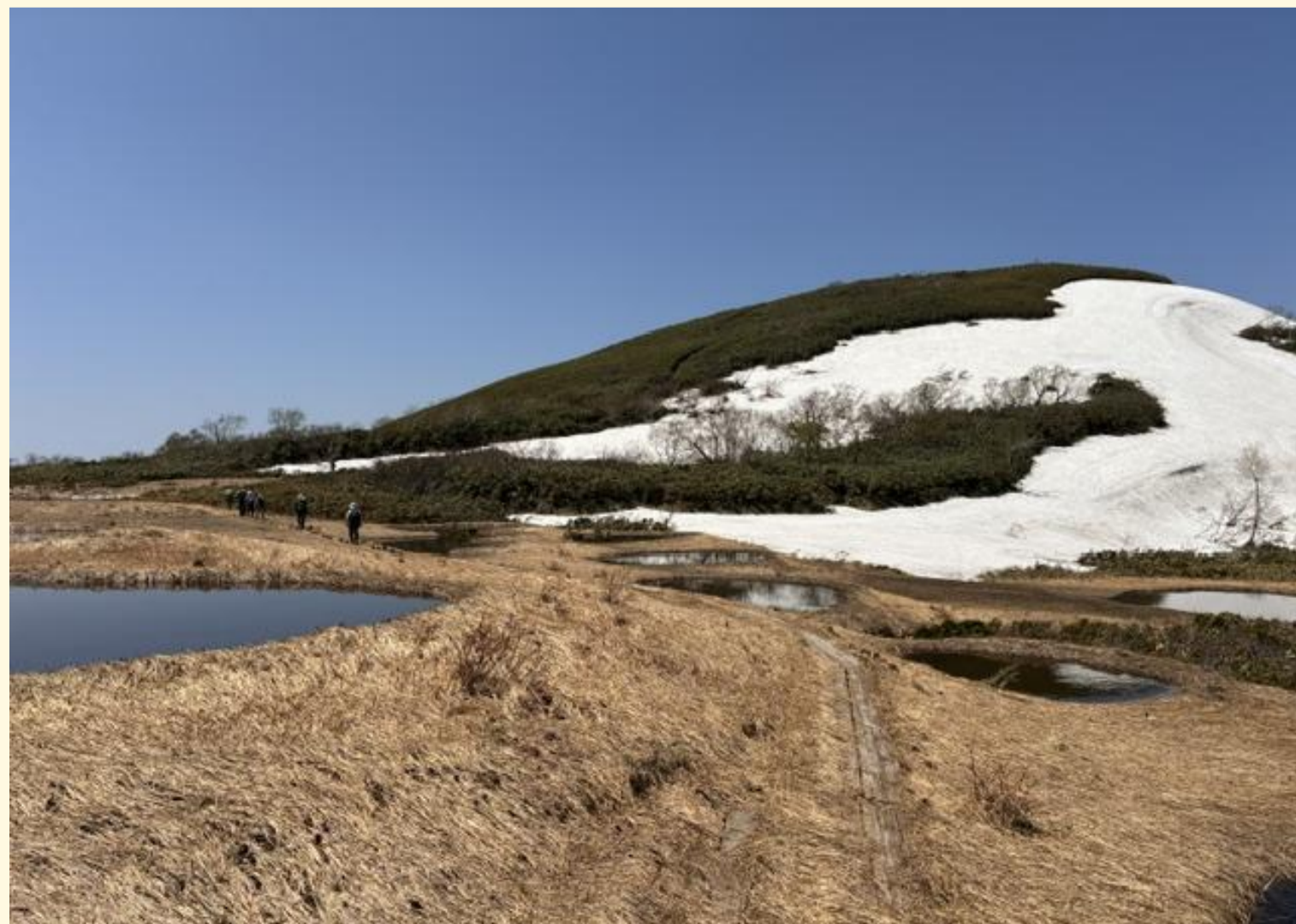
ようやく木道が見える湿原に到着。頂上まであと少し。